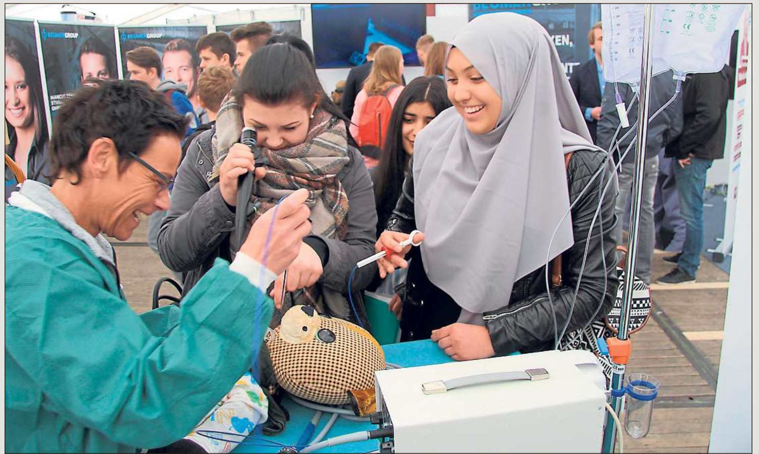
Die Ausbildungsmesse „Mach mit“ findet am Freitag, 4., und Samstag, 5. Mai, im Oelder Vier-Jahreszeiten-Park statt. Die ausstellenden Ausbildungsbetriebe bieten den Teilnehmern viele Aktionen an wie hier das Oelder Marienhospital 2016.

Am Sonntag, 6. Mai, 14 bis 18 Uhr, findet an gleicher Stelle ein Forscherfest für Mädchen und Jungen statt. Die Jüngsten haben Gelegenheit, an den Ständen einiger Unternehmen sowie bei Angeboten der Oelder Kindertagesstätten und Schulen sich an Aktionen zu erfreuen und sich in kleinen Aufgaben zu erproben.