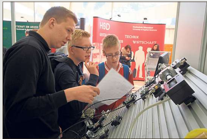
Die „Mach mit“ wird seit 2002 im Zwei-Jahres-Rhythmus durchgeführt und hat sich zur festen Größe für die Schüler der achten und neunten Klassen auf ihrem Weg in den Beruf entwickelt.

die die jungen Projektteams zum Thema „Move it! – Bring es ins Rollen!“ mit Auszubildenden Oelder Betriebe erarbeitet haben. Die 16 eingereichten Filme sind unter www.mach-mit-ennigerloh.de zu sehen.