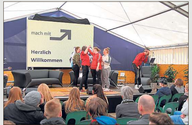
Für Unterhaltung zeichnet das Improvisationstheater Emscherblut verantwortlich, das auf Zuruf Alltagsszenen rund um das Thema Ausbildung spielt.