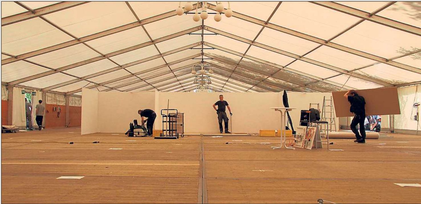
70 Aussteller aus Oelde, Ennigerloh und der Region informieren im Forumzelt im Oelder Vier-Jahreszeiten-Park über ihre Ausbildungsberufe. Derzeit werden die Messestände aufgebaut. Am morgigen Freitag öffnet die Ausbildungsmesse „Mach mit“ ihre Pforten für mehr als 1000 Schüler der Jahrgangsstufen 8 und 9.